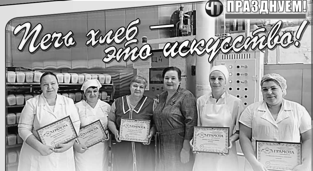
Недавно представители Северной районной профсоюзной организации работников АПК посетили ООО «Афипский хлебокомбинат». Это случилось в преддверии Дня работника сельского хозяйства и перерабатывающей промышленности.

С вековым юбилеем, профсоюз работников АПК края! У вашей организации — замечательное прошлое, стабильное настоящее и перспективное будущее!