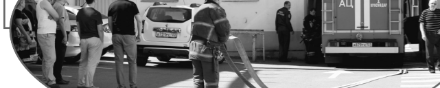
Участники тренировки по эвакуации и тушению условного пожара в здании почтамта и филиала УФПС края.