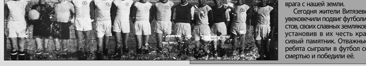
Победители краевого фотоконкурса «Победа в наших сердцах» награждены Дипломами Краснодарского краевого профобъединения и денежными премиями. Работы победителей фотоконкурса размещены на сайте регионального профобъединения в разделе «Конкурсы». С работами всех участников можно ознакомиться в разделе сайта «75 лет — Победа — 1941-1945».