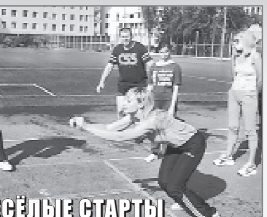
40 ВЕСЁЛЫЕ СТАРТЫ. За последние четыре года тестирование ГТО прошли все сотрудники Управления, получившие в установленном порядке медицинский допуск к сдаче нормативов ВФСК ГТО.

Недавно пять сотрудников — члены первичной профорганизации — Управления по вопросам семьи и детства сочинской администрации приняли участие в городском осеннем фестивале Всероссийского физкультурно-спортивного комплекса «Готов к труду и обороне» (ГТО). Мероприятие состоялось на открытом воздухе, с учётом всех требований Роспотребнадзора. Соревнования проходили на стадионе сочинской спортивной школы №1. Участники фестиваля сдали нормативы по нескольким дисциплинам комплекса — бег на 30 и 60 метров, отжимание, гибкость, прыжок в длину с места и двухкилометровый забег. Т.ГРЕШКОВА, Председатель первичной профорганизации Управления по вопросам семьи и детства администрации г.Сочи.