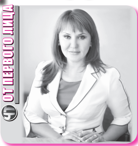
Уважаемые друзья, коллеги, члены профсоюзов Кубани!

Краевым же профобъединением было направлено в региональные организации отраслевых профсоюзов 548 тысяч рублей на оказание адресной благотворительной помощи членам профсоюзов, оказавшимся в сложной жизненной ситуации. Профсоюзы края сделали всё, чтобы не оставить людей в этой чрезвычайной ситуации одних со своими проблемами. Профактивисты и волонтеры включились в работу мобильных групп, составляли списки пострадавших, расчищали