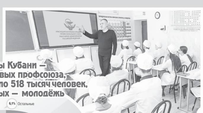
Профсоюзы Кубани — это 23 отраслевых профсоюза, объединяющие около 518 тысяч человек, треть из которых — молодёжь