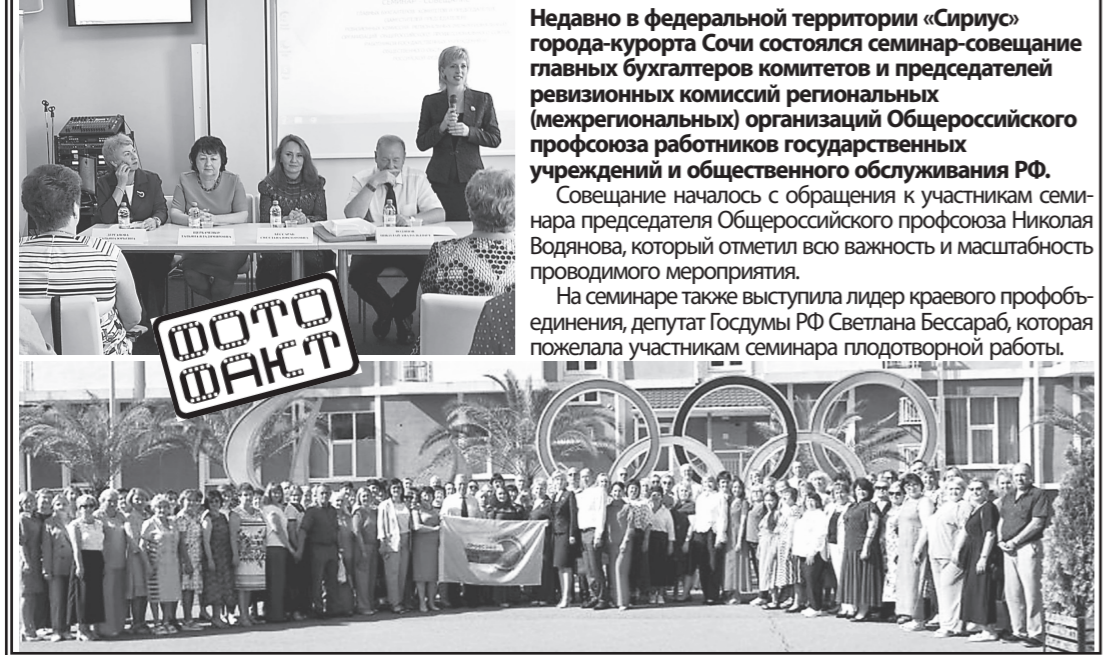
Недавно в федеральной территории «Сириус» города-курорта Сочи состоялся семинар-совещание главных бухгалтеров комитетов и председателей ревизионных комиссий региональных (межрегиональных) организаций Общероссийского профсоюза работников государственного учреждения и общественного обслуживания РФ.