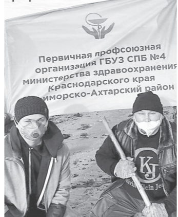
Первичная профсоюзная организация ГБУЗ СПБ №4 министерства здравоохранения Краснодарского края морско-Ахтарский район

Всего в этой важной волонтерской работе приняли участие более 5 тыс. членов профсоюзов.